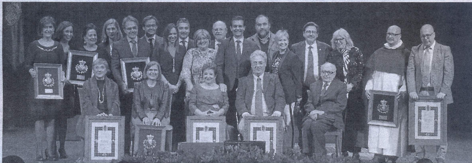
Concejales y galardonados en la foto de familia.