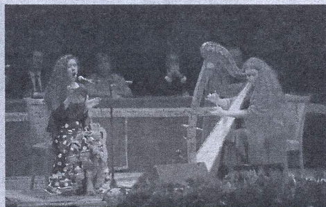
Un momento de la gala.